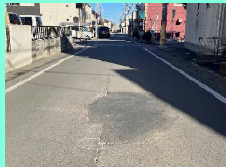
市道の修繕（西狭山ヶ丘1丁目）