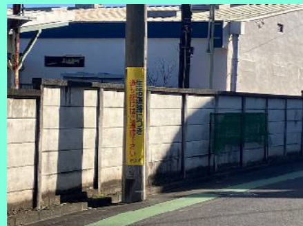
巻き看板の設置（若狭1丁目）