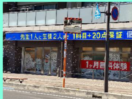
カーブミラーの修繕（小手指町1丁目）