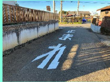
路面標示の再塗装（堀之内）

各自治会や地域にお住まいの方々からご相談やご要望をいただき、市の担当課等と協議の上、対応させていただいた事案の一部をご紹介します。関係地権者の方をはじめ、ご協力いただいた皆様には心より感謝申し上げます。