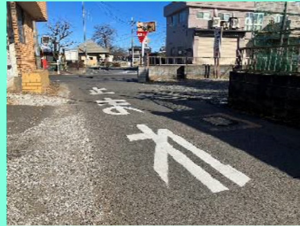
路面標示の再塗装（林1丁目）