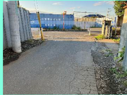
市道の修繕（三ヶ島4丁目）